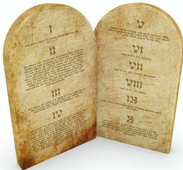
LA LOI ÉCRITE